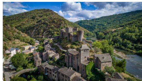
Brousse-le-Chateau vue village et riviere