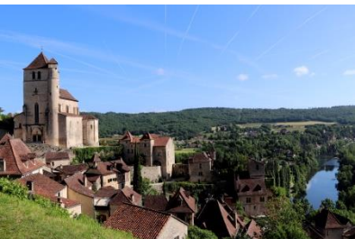
Saint-Cirq-Lapopie, vue village et Lot